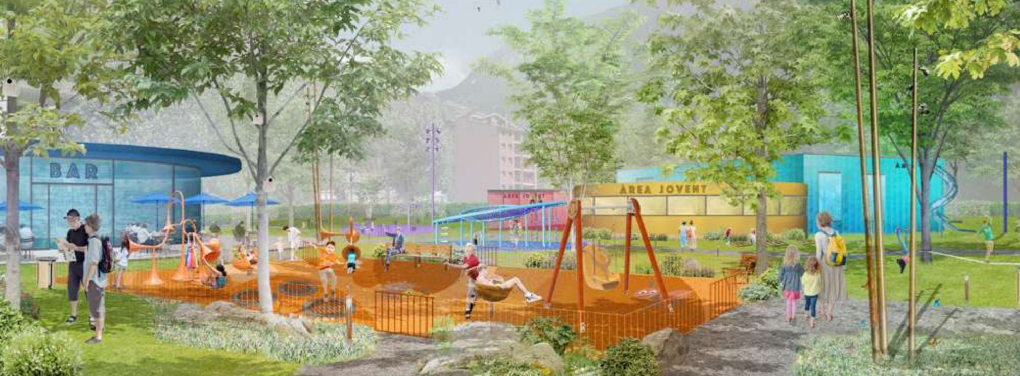
2n PREMI · MIQUEL MERCE ARQUITECTE