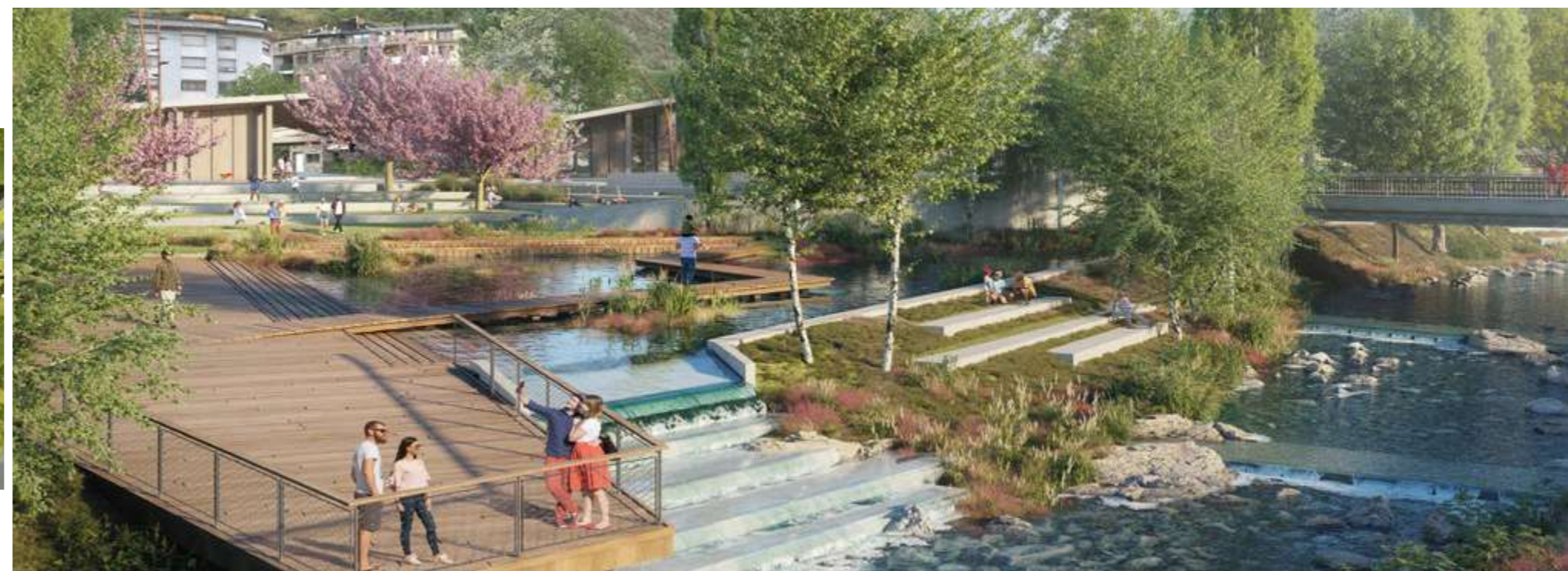
1r PREMI · ALTURA ARQUITECTES